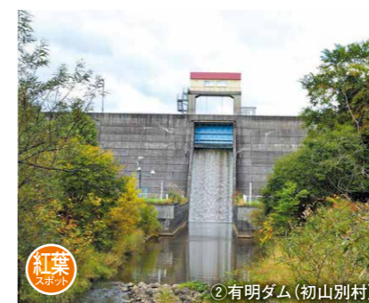
② 有明ダム (初山別村)