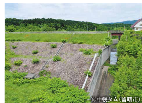
⑧ 中幌ダム (留萌市)