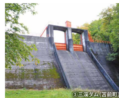
③ 三溪ダム (苫前町)