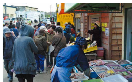
鮮度抜群の魚介類が手に入る朝市

4月上旬から10月中旬、ほぼ毎日漁港入り口にて前浜で獲れたての魚介類を販売する朝市が開催されていて賑わっている。