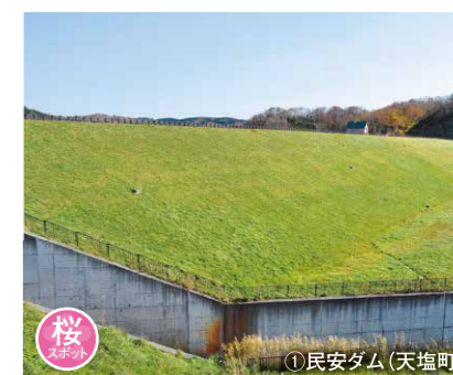
① 民安ダム (天塩町)