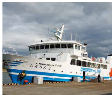
フェリーターミナル