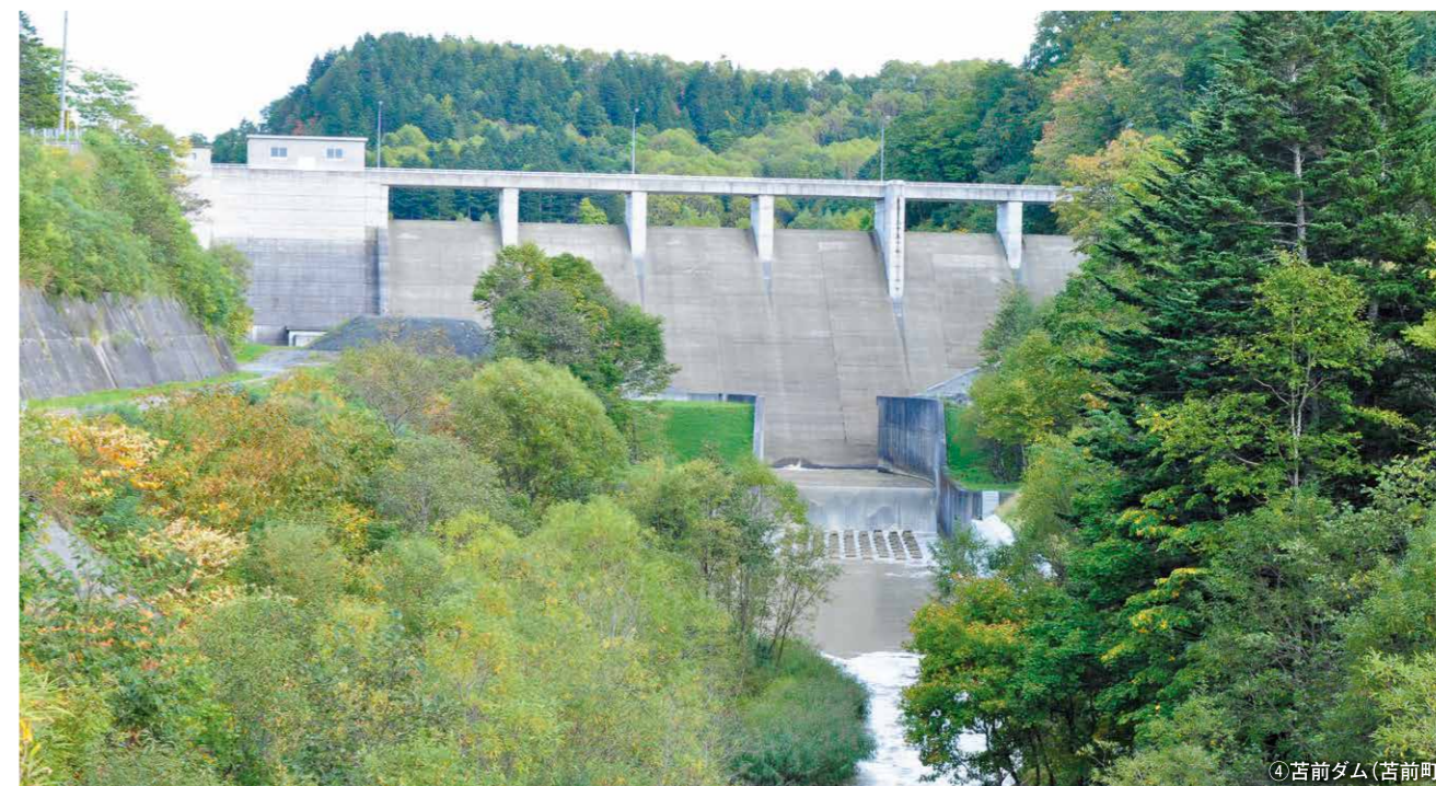
④ 苫前ダム (苫前町)