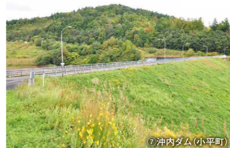
⑦ 沖内ダム (小平町)

所在地 / 小平町沖内 244-3 ダム形式 / アース (ゾーン型) 河川名 / 沖内川 ダム湖名 / — 完成年度 / 1995年 用途 / 洪水調整、農地防災、かんがい用水 堤高 / 29.6m 堤頂長 / 157.0m 建設 / 北海道 管理 / 小平町