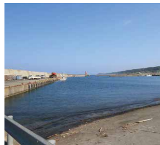
右/鬼鹿漁港内の様子 左/ビーチの中央にある日時計

留萌港すぐ北に位置する小さな漁港だが、空気がまったりと異なり、穏やかな雰囲気漂う港だ。