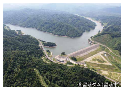
⑨ 留萌ダム (留萌市)

所在地 / 留萌市幌糠町奥幌糠 ダム形式 / アース (ゾーン型) 河川名 / 中幌糠川 ダム湖名 / — 完成年度 / 1990年 用途 / 洪水調整、農地防災 堤高 / 25.8m 堤頂長 / 123.0m 建設 / 北海道 管理 / 留萌市