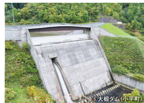
⑤ 大榎ダム (小平町)