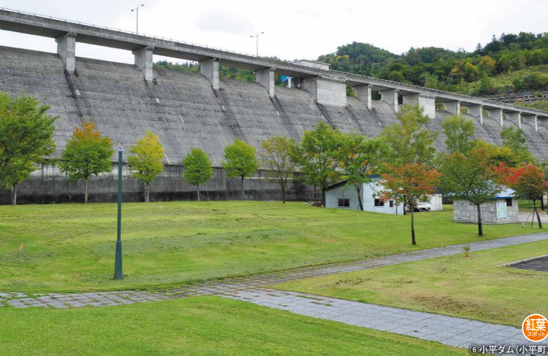
⑥ 小平ダム (小平町)

所在地 / 小平町滝下 ダム形式 / 重力式コンクリート 河川名 / 小平苺川 ダム湖名 / おびらしべ湖 完成年度 / 1992年 用途 / 洪水調整、農地防災、不特定用水、河川維持用水、かんがい用水、上下水道用水 堤高 / 42.4m 堤頂長 / 475.0m 管理 / 北海道